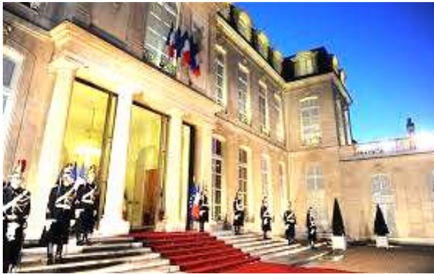
نمایی از کاخ الیزه

نظام سیاسی فرانسه، جمهوری شبه‌ریاستی یا نیمه‌ریاستی است و اصل تفکیک نسبی قوا طبق قانون اساسی این کشور رعایت می‌شود. از زمان جمهوری پنجم در سال ۱۹۵۸ رئیس‌جمهور از اختیارات بسیار برخوردار و در رأس قوه مجریه قرار دارد.