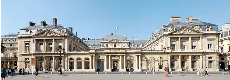
تصویری از ساختمان شورای دولتی فرانسه

چند مستشار و تعداد کافی ممیز می‌باشد. شورا تصمیمات خود را در شعب و یا در کمیسیون متشکل از دو یا چند شعبه و بالاخره در هیأت عمومی که مرکب از کلیه شعب است اتخاذ می‌کند.