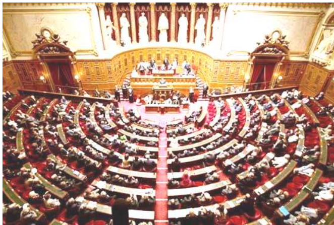
تصویری از پارلمان فرانسه

پارلمان فرانسه که پیشینه تأسیس آن به انقلاب فرانسه در سال ۱۷۸۹ برمی‌گردد دارای ۵۷۷ عضو است که همگی با رأی مستقیم مردم انتخاب می‌شوند.